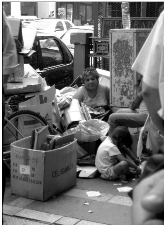
Recolección informal: una imagen repetida

Sin embargo, luego de varios meses la planta no ha entrado en funcionamiento efectivo, y la puesta en marcha de otros centros es una posibilidad distante, por lo cual se mantienen vigentes convenios con distintas cooperativas a los efectos de continuar con las tareas de recolección diferenciada que actualmente, en muy pequeña escala, se realiza en la ciudad.