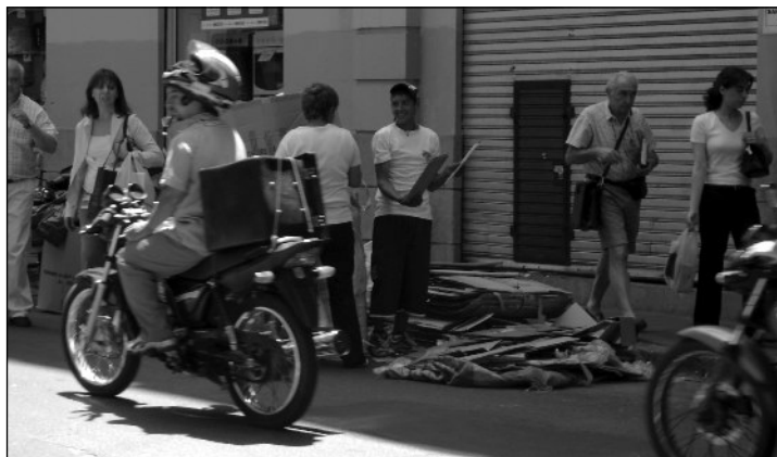
Otra postal del cartoneo en el mediodía porteño