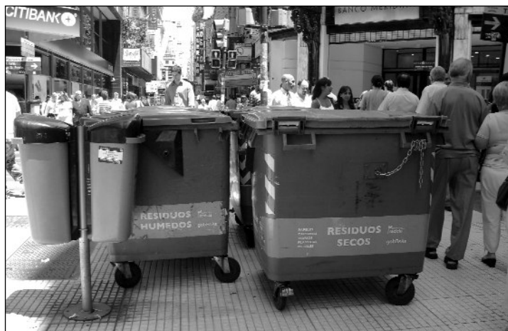
Para separar la basura

Dentro de las acciones adoptadas para la Recolección de Residuos Sólidos Urbanos, se requirió una activa participación de los vecinos. En el marco de una prueba piloto, se efectuó un registro de aproximadamente 9 mil hogares que participarían en estas tareas. Como objetivo concreto y específico, se pretendía lograr y mantener en el tiempo el concepto de separación en origen de los residuos en húmedos/orgánicos y secos/inorgánicos,