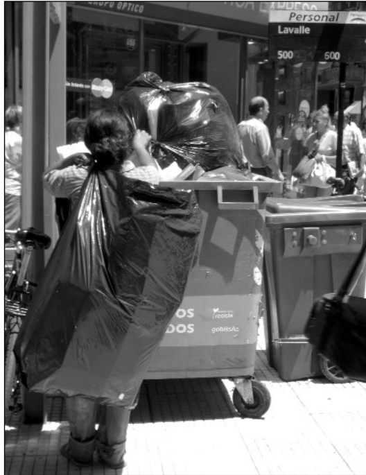
Una cartonera en Laval y Florida, diciembre de 2006

y permitir que los recolectores informales no tuvieran que realizar esta tarea en la vía pública.