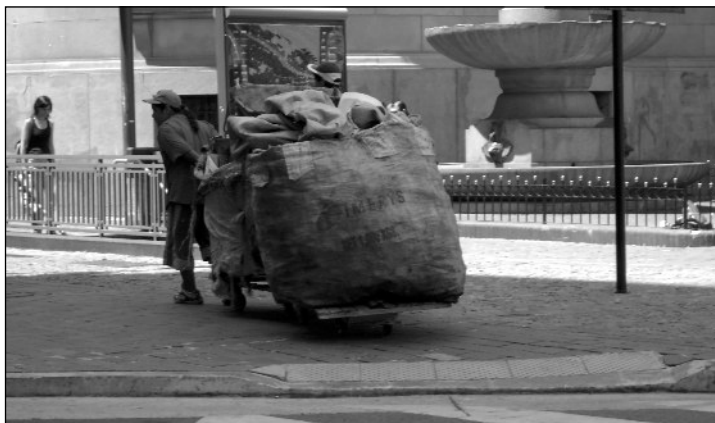
El trabajo infantil, otra cara del negocio de la basura

sobre el Trabajo Infantil de la Organización Internacional del Trabajo celebrada en Oslo también en 1997".